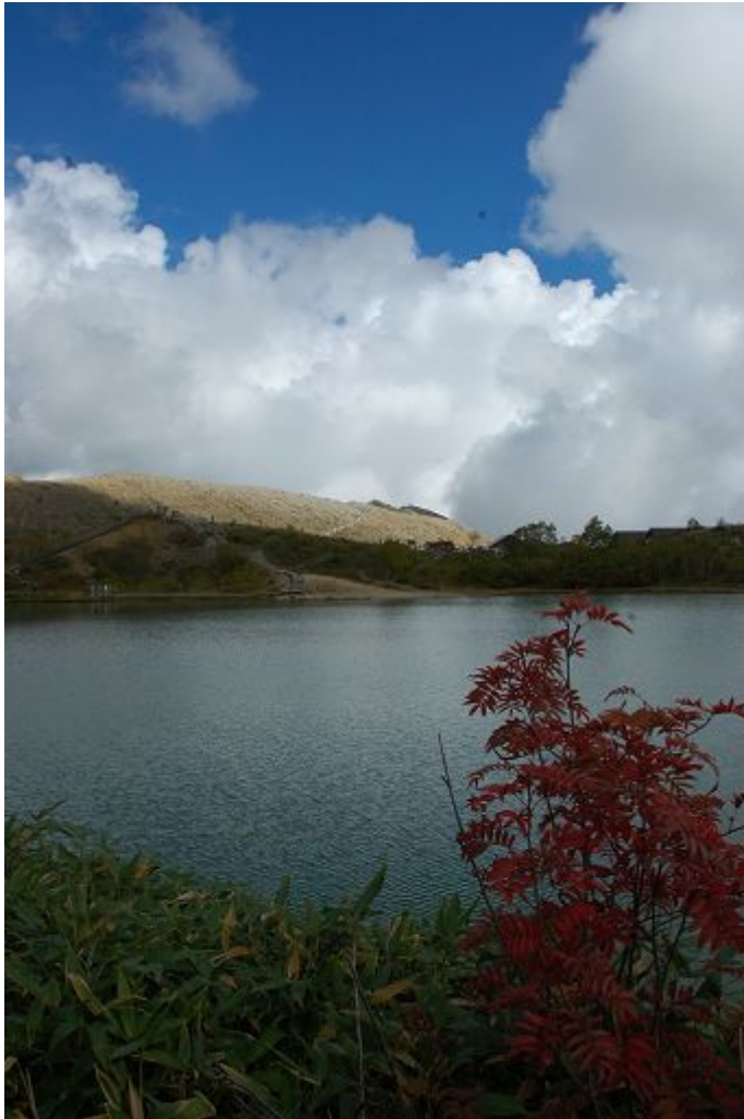
10月初旬の弓池は秋真っ盛り