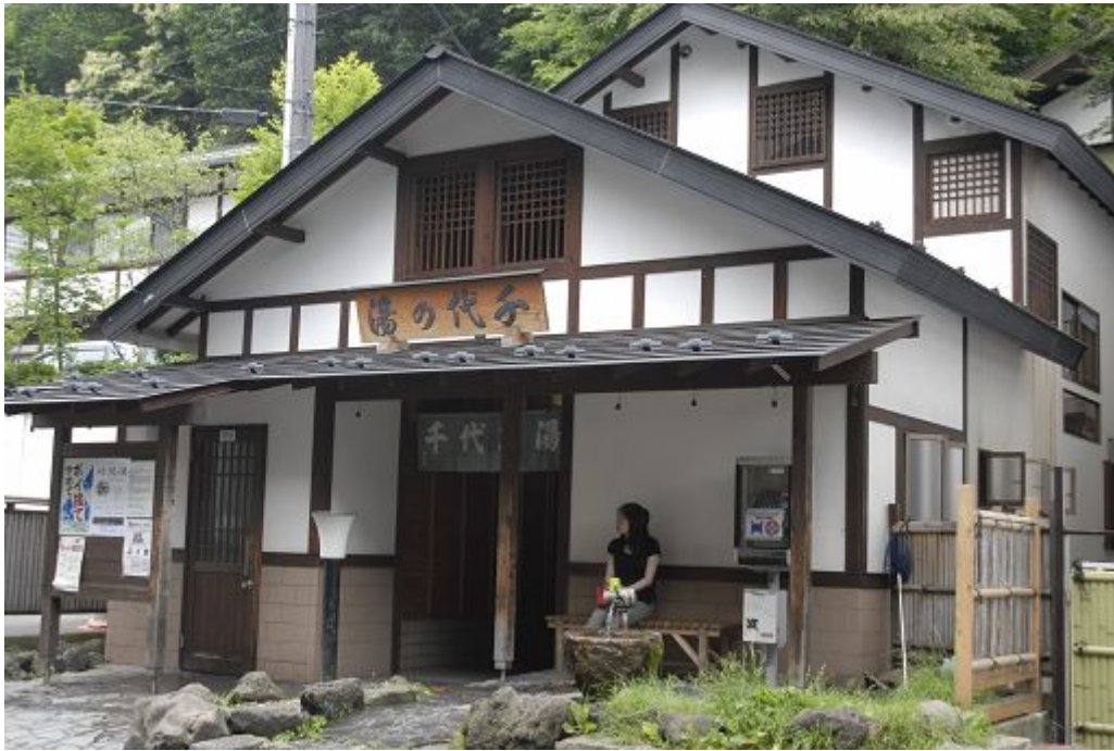
千代乃湯 湯畑の下方「滝下通り」に立つ共同浴場。入浴無料