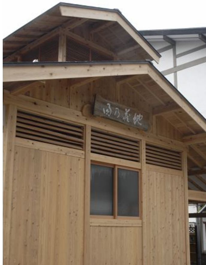
地蔵の湯 すぐ前に源泉“地蔵の湯”が湧く共同浴場。入浴無料